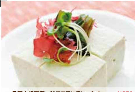
①青木綿豆腐 秘伝青豆は優しい食感 ¥570