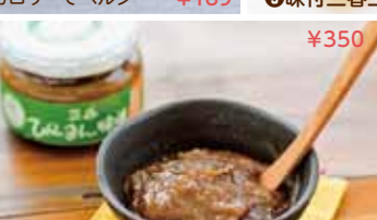
⑭ぴーまん味噌 ごはんが何杯でもいけちゃう! ¥350