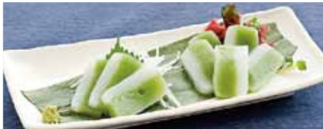
⑫スライスコンニャク 低カロリーでヘルシー ¥189