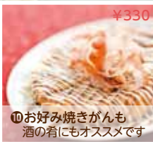
⑩お好み焼きがんも 酒の肴にもオススメです ¥330