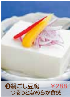
③絹ごし豆腐 ¥288 つるつるとなめらか食感