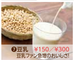
⑦豆乳 ¥150/¥300 豆乳ファン急増のおいしさ!