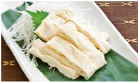
④刺身ゆば 濃厚な大豆の甘さが魅力 ¥588