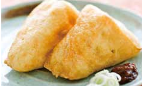
⑧三春三角油揚 三春名物。厚みが自慢です ¥375