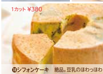
⑯シフォンケーキ 絶品。豆乳のほわっほわ 1カット ¥380