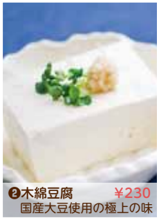
②木綿豆腐 ¥230 国産大豆使用の極上の味