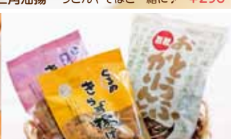
⑮さらず揚げ くせになる歯ごたえが人気 ⑯おとうふかりんと ⑯ ¥315 ⑰ ¥350