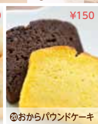
⑱おからパウンドケーキ ¥150