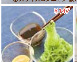
⑬コンニャクソーメン 低カロリー。ダイエットにも ¥147